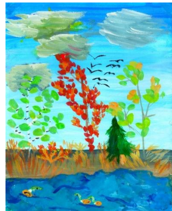
Морозова Дарья 7 лет

В реке росло много кувшинок, их широкие зеленые листья плавали по воде. На самый широкий лист кувшинки жаба и посадила Дюймовочку.